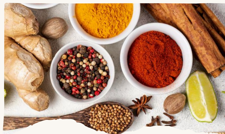
Nguyên liệu Thực phẩm