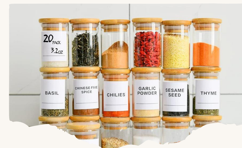
Nhãn hiệu riêng