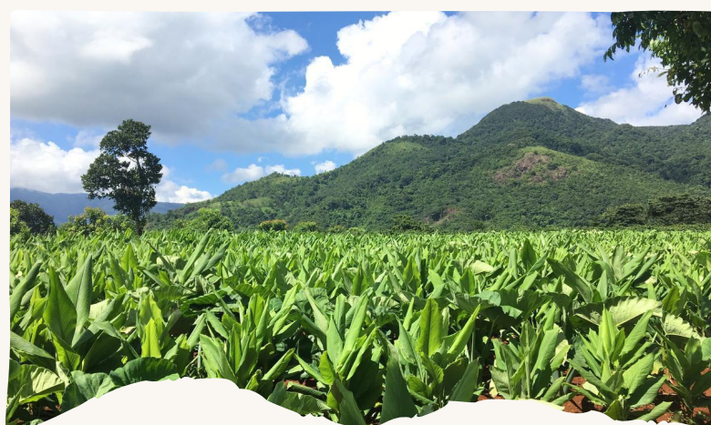
Phát triển Vùng trồng