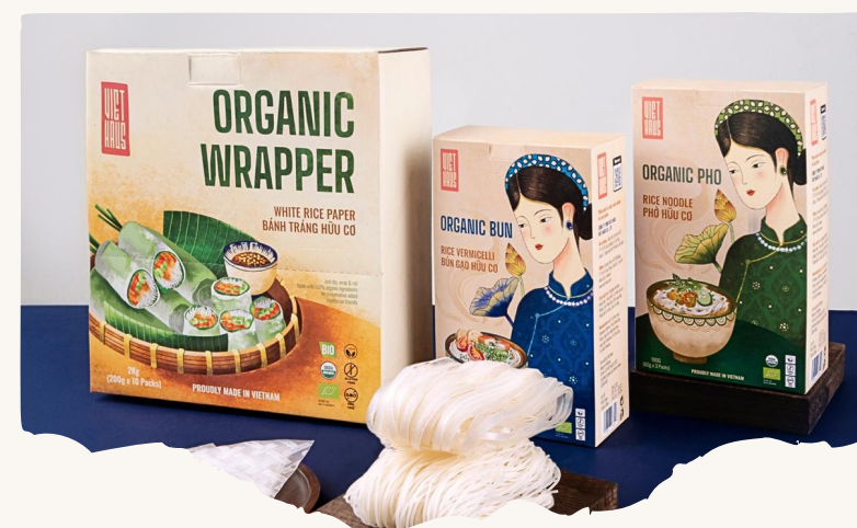
Thương hiệu tiêu dùng